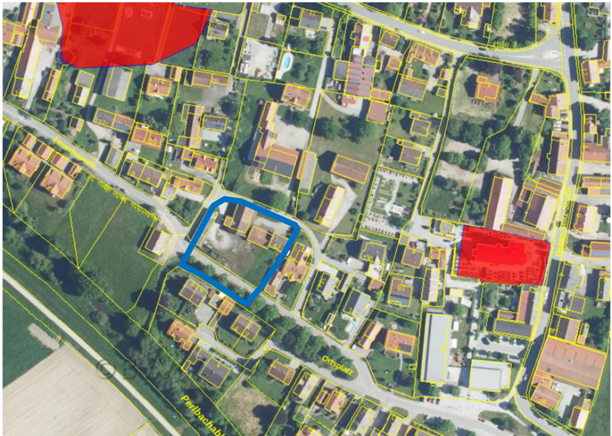
Abbildung 5: Ausschnitt aus dem BayernAtlas, rot = Bodendenkmäler - ohne Maßstab

Gemäß Bayerischem Denkmalatlas befinden sich im Geltungsbereich selbst keine Bodendenkmäler. In der weiteren Umgebung sind jedoch einige vorhanden.