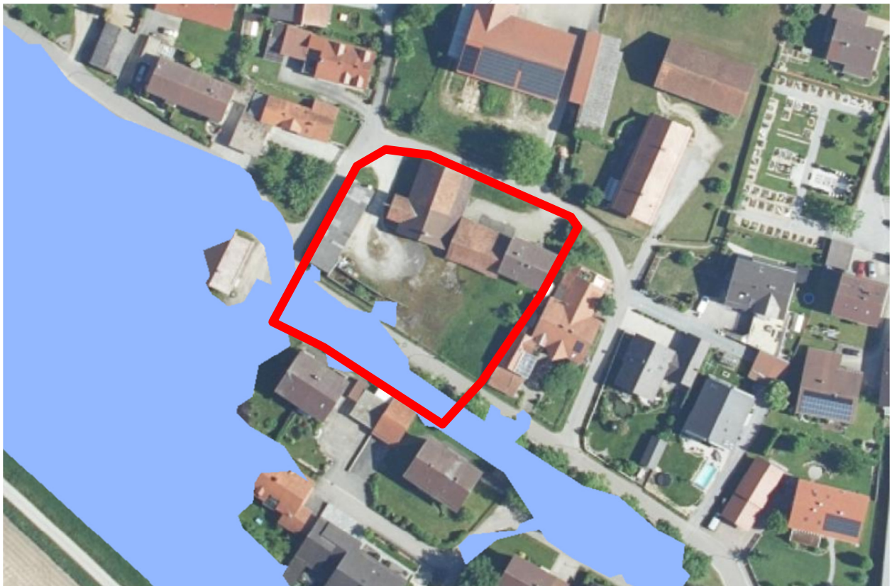
Abbildung 6: Ausschnitt aus dem BayernAtlas, blau = Hochwassergefahrenfläche HQ 100 - ohne Maßstab

Gemäß BayernAtlas befindet sich das Plangebiet außerhalb von festgesetzten Überschwemmungsgebieten, aber im südlichen Geltungsbereichsteil, entlang des Entwässerungsgrabens in kleinen Teilen innerhalb der Hochwassergefahrenflächen HQ 100. Die Geländehöhen der betroffenen Bereiche dürfen nicht verändert werden, die Höhenkoten sind beizubehalten.