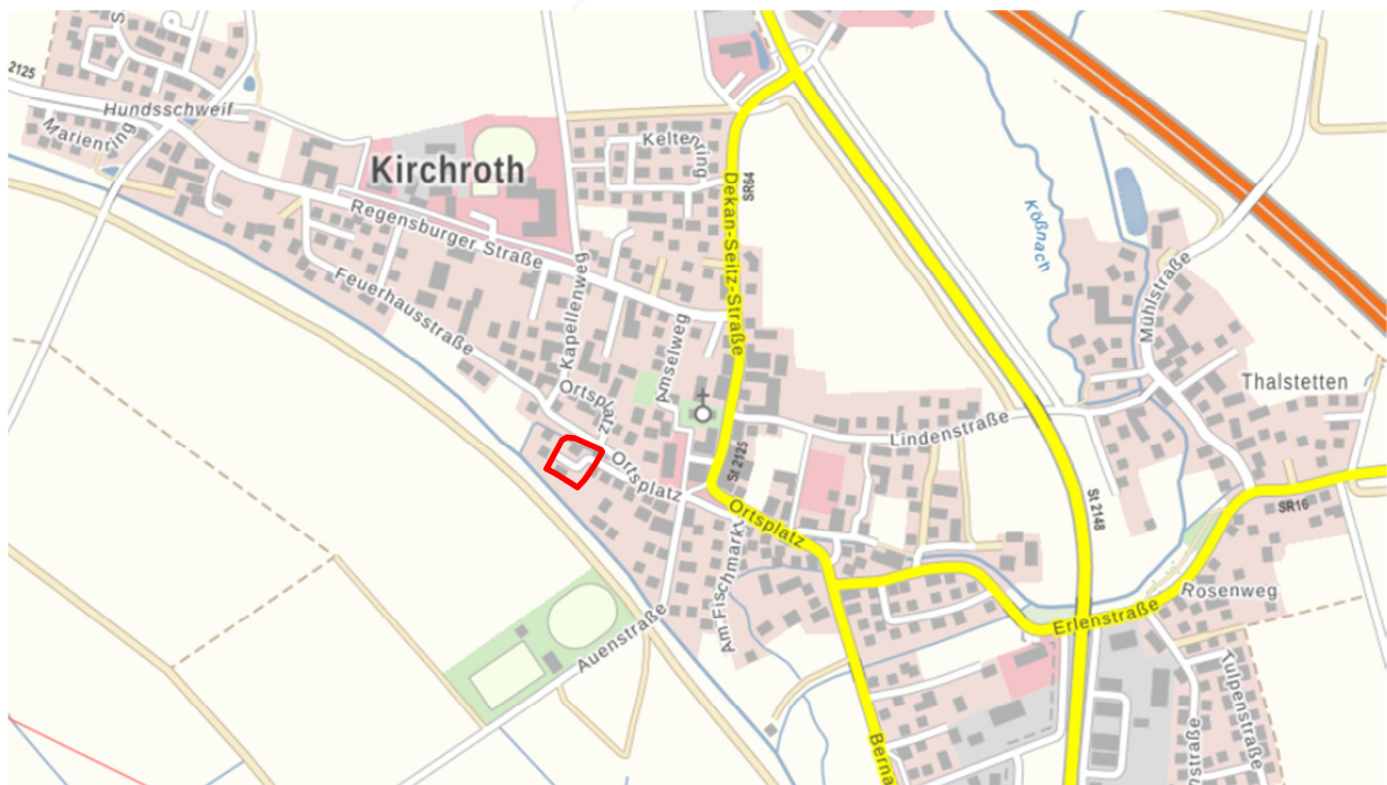
Abbildung 1: Übersichtslageplan aus dem BayernAtlas vom 01.08.2023 - ohne Maßstab