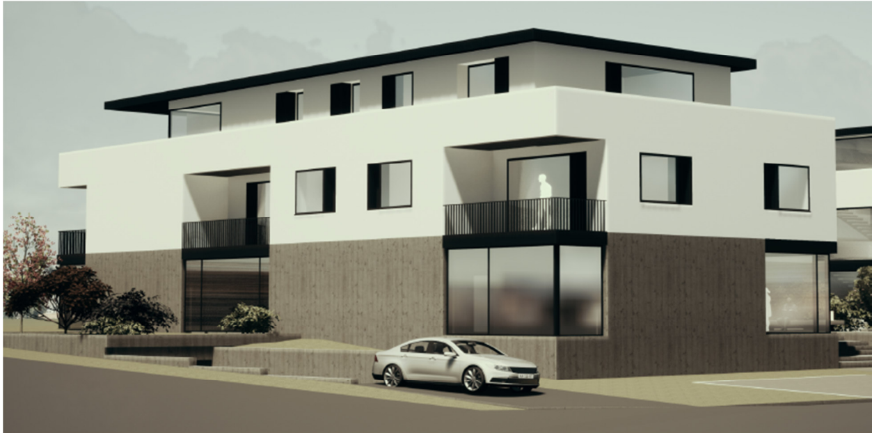
Abbildung 7: Visualisierung, bast+ascherl, Straubing November 2022 - ohne Maßstab

Der Gebäudekörper ist als U-förmige Bebauung geplant, so dass sich ein zentraler Platz und Eingangssituation ergibt. In der Tiefgarage, welche von der südlichen Erschließungsstraße erschlossen wird finden ca. 27 Stellplätze und entsprechende Kellerabteile Platz. Vorgelagert sind weitere 10 Pkw-Stellplätze sowie entsprechende Nebengebäude für Fahrräder und Müll.