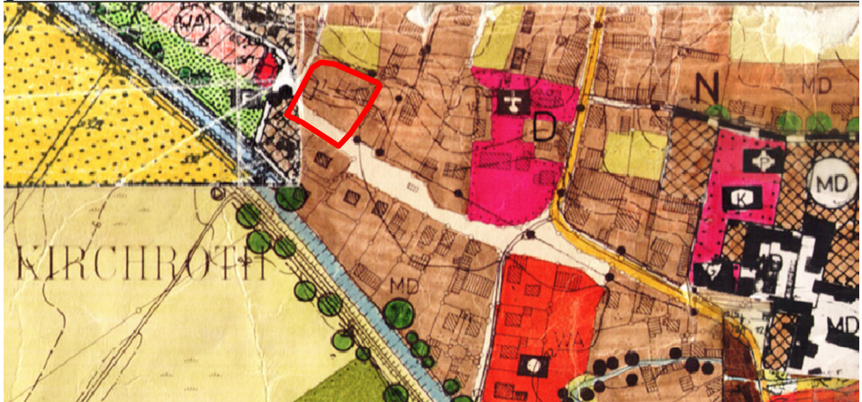
Abbildung 3: Ausschnitt aus dem derzeit rechtsgültigen Flächennutzungsplan - ohne Maßstab

Mit Bescheid der Regierung von Niederbayern vom 26.07.1983 und Ergänzungsbescheid vom 20.12.1988 (Nr. 420-4621.941) wurde für die Gemeinde Kirchroth ein Flächennutzungsplan genehmigt. Darin ist das geplante Gebiet bereits als Dorfgebiet dargestellt.