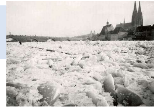
1893 Eisgang Regensburg oberhalb der steinernen Brücke

1893 Eishochwasser - sehr hohe Wasserstände durch den Eisstoß (1/2 m höher als beim Donaudammbruch in Kiefelmauth 1988).