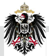
Deutsches Kaiserreich 1871-1918

1871 Gründung des Deutschen Kaiserreichs - Bayern wurde Bundesstaat des neu gegründeten Deutschen Reiches, konnte aber seine Einheit bewahren.