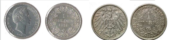
1 Gulden bis 1873

1873 Währungsumstellung - Mark (M) und Pfennige (Pf) statt Gulden (G) und Kreuzer (xr). Ein Gulden (fl) war ursprünglich in 60 Kreuzer (xr) unterteilt, ab 1857 hatte ein Gulden 100 Kreuzer.