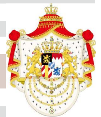
Königreich Bayern Großes Wappen ab 1835