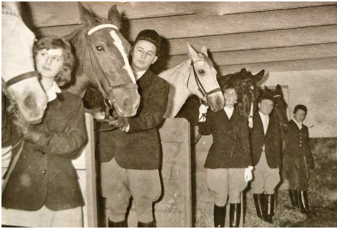
Die ersten Stallungen mit Mitgliedern des Straubinger Reitclubs