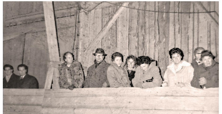
Tribüne in der zur Reithalle umgebauten Scheune

berichtete das Straubinger Tagblatt. Die erfolgreichen Reiter nahmen an weiteren Turnieren teil und brachten Pokale mit nach Hause.