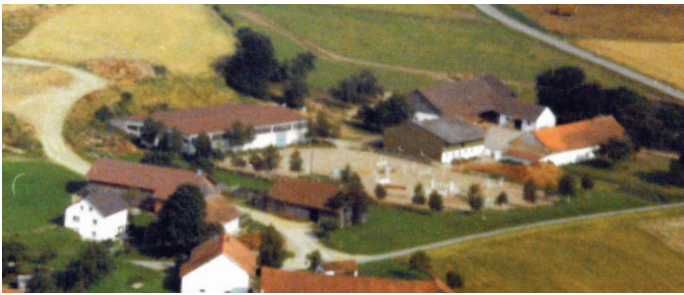
um 1980 Münsterer Straße 11