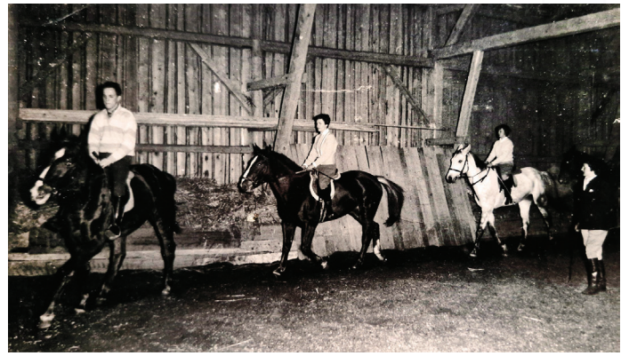
Reitunterricht in der zur Reithalle umgebauten Scheune

Alle Teilnehmer mussten sich an der Meldestelle einschreiben, und jedes Pferd erhielt eine Startnummer am Halfter. Es kamen Busse angerollt, und sowohl Einheimische als auch Fremde kamen zum Zuschauen. Aus Lautsprechern wurden die Ergebnisse der Reiter verkündet, und schon am Montag