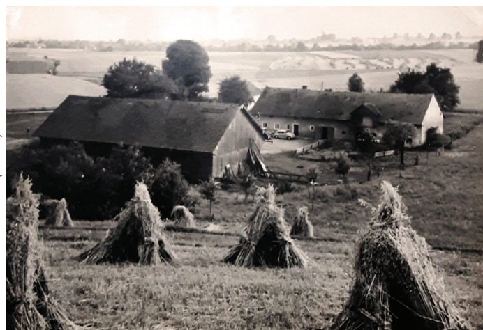
um 1950, der Stelzl-Hof, Aufroth Nr. 12